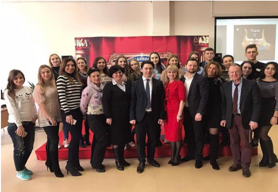
Зустріч із директором департаменту туризму і курортів Міністерства економічного розвитку і торгівлі України Іваном Ліптугою, березень 2017 р.