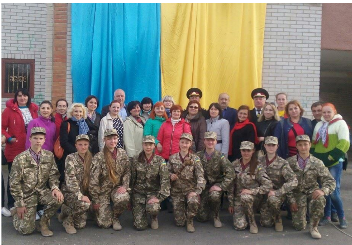
Засідання першої Всеукраїнської школи тренерів з національно-патріотичного виховання, м. Крижопіль Вінницької обл., квітень 2017 р.