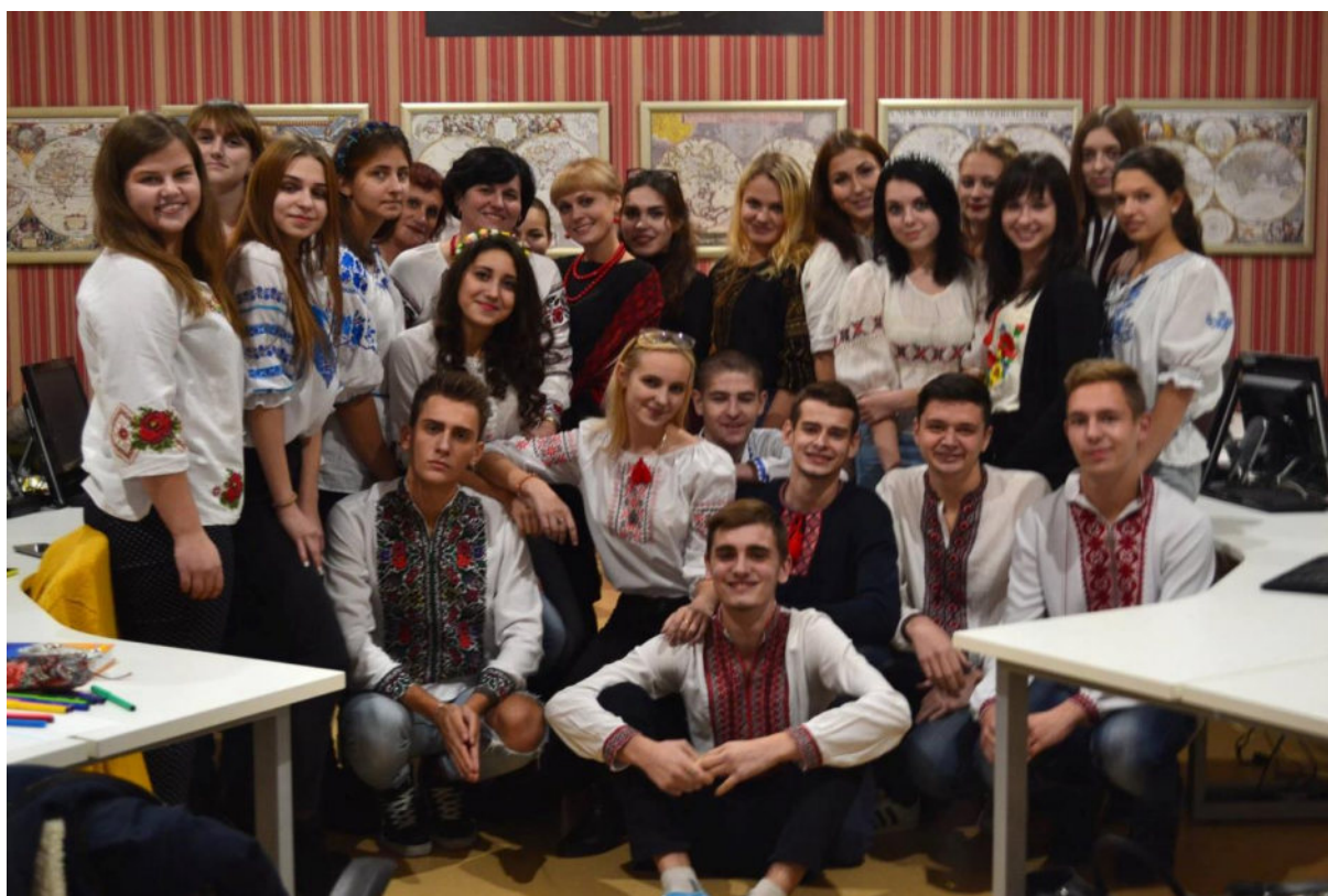
Кураторська година у форматі тренінгу "Мова нації – в серці кожного", 9 листопада 2016 р.