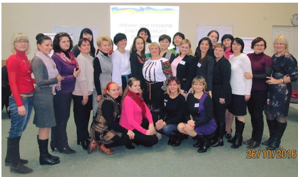
Учасники сертифікованої програми Міністерства освіти і науки України "З Україною в серці", тренери з національно-патріотичного виховання, жовтень 2016 р.

Маємо надію, що Міністерство освіти і науки України (далі – МОН) буде активно підтримувати ідею впровадження інноваційних методик національно-патріотичного виховання дітей та молоді і створюватиме умови для побудови загальноукраїнської системи підготовки педагогів-виховників-тренерів та популяризації їх кращого досвіду».